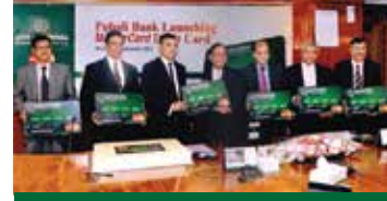
‘মাস্টারকার্ড ডেবিট কার্ড’ চালু করল পূবালী ব্যাংক লিমিটেড