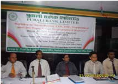
নোয়াখালী অঞ্চল কর্তৃক দিনব্যাপী কর্মশালা অনুষ্ঠিত

উক্ত সাক্ষাতে ব্যাংকের সাথে বৈদেশিক বাণিজ্য সম্প্রসারণে বিনিয়োগ সুবিধা নিয়ে বিস্তারিত আলোচনা হয়। উল্লেখ্য যে, এরপর পৃষ্ঠা ৫ কলাম ২