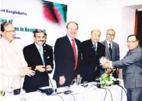
রেমিট্যান্স প্রবাহ বৃদ্ধিতে অবদানের জন্য পূবালী ব্যাংক লিমিটেডের সম্মাননা প্রাপ্তি