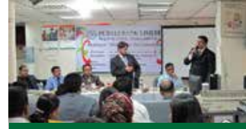
"What a Banker does dawn to dusk" শীর্ষক কর্মশালা

উক্ত কর্মশালায় আলোচকবৃন্দ উল্লেখ্য করেন, জলবায়ু পরিবর্তন জনিত সমস্যা সংকুল দেশ গুলোর মধ্যে বাংলাদেশ অন্যতম। কাজেই পরিবেশগত ঝুঁকি মোকাবেলায় গ্রীন ব্যাংকিং কার্যক্রম একটি যুগোপযোগী পদক্ষেপ। এরই ধারাবাহিকতায় ঋণ বিভাগের সহযোগিতায় পূবালী ব্যাংক লিমিটেড বাংলাদেশ ব্যাংকের গ্রীন ব্যাংকিং নীতিমালা এরপর পৃষ্ঠা ৫ কলাম ১