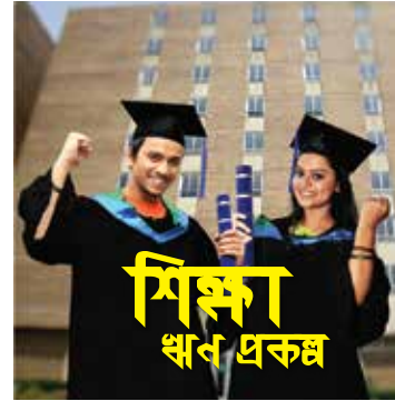
শিক্ষা ঋণ প্রকল্প

অনুষ্ঠানে পূবালী ব্যাংক লিমিটেড প্রধান কার্যালয়ের মহাব্যবস্থাপকবৃন্দ এবং ব্যাংকের উর্ধ্বতন নির্বাহীবৃন্দ এসময় উপস্থিত ছিলেন।