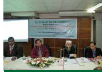
মানিলভারিং প্রতিরোধ ও পরিপালন বিষয়ক কর্মশালা অনুষ্ঠিত

অনুষ্ঠানে ব্যাংকের সামগ্রিক মুনাফায় ভোক্তা ঋণের অবদান, যথার্থ গ্রাহক নির্বাচন পূর্বক ব্যাংকিং আইন ও প্রবিধি অনুযায়ী ঋণ প্রদান, ব্যাংক-গ্রাহক-এজেন্ট সম্পর্ক উন্নয়ন, বিভিন্ন ধরনের ভোক্তা ঋণ প্রদানে করণীয়, প্রয়োজনীয় কাগজ পত্র ও দলিলাদি গ্রহণ, ঋণ তদারকী ও আদায়ের প্রয়োজনীয় ও আইনগত দিক, ঋণ খেলাপীর বিরুদ্ধে মামলার প্রক্রিয়া প্রভৃতি বিষয়ে দিন ব্যাপী আলোচনা হয়। অনুষ্ঠানে বক্তাগণ শাখা ব্যবস্থাপকদের পেশাগত ও সেবার মনোভাব নিয়ে ভোক্তাঋণ কার্যক্রম আরো গতিশীল করতে আহ্বান জানান।