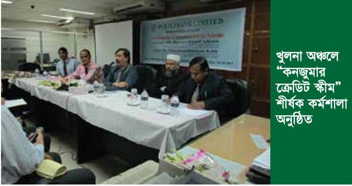
খুলনা অঞ্চলে “কনজুমার ক্রেডিট স্কীম” শীর্ষক কর্মশালা অনুষ্ঠিত