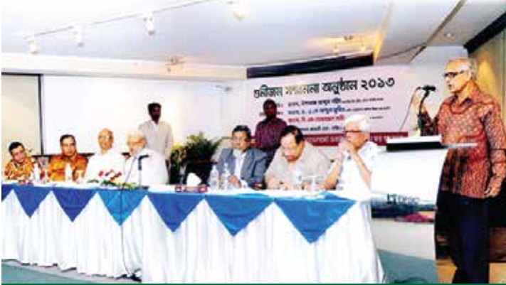
প্রতিভা বিকাশ সোশ্যাল ডেভেলপমেন্ট ভলান্টারি অ্যাসোসিয়েশন ফর বাংলাদেশ আয়োজিত গুণীজন সম্মাননা অ্যাওয়ার্ড-২০১৩